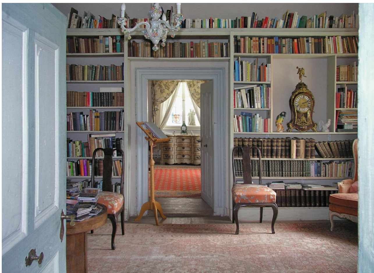
Markt Nordheim | Schloss Seehaus

Ihnen ist folgendes genauso wichtig wie uns: