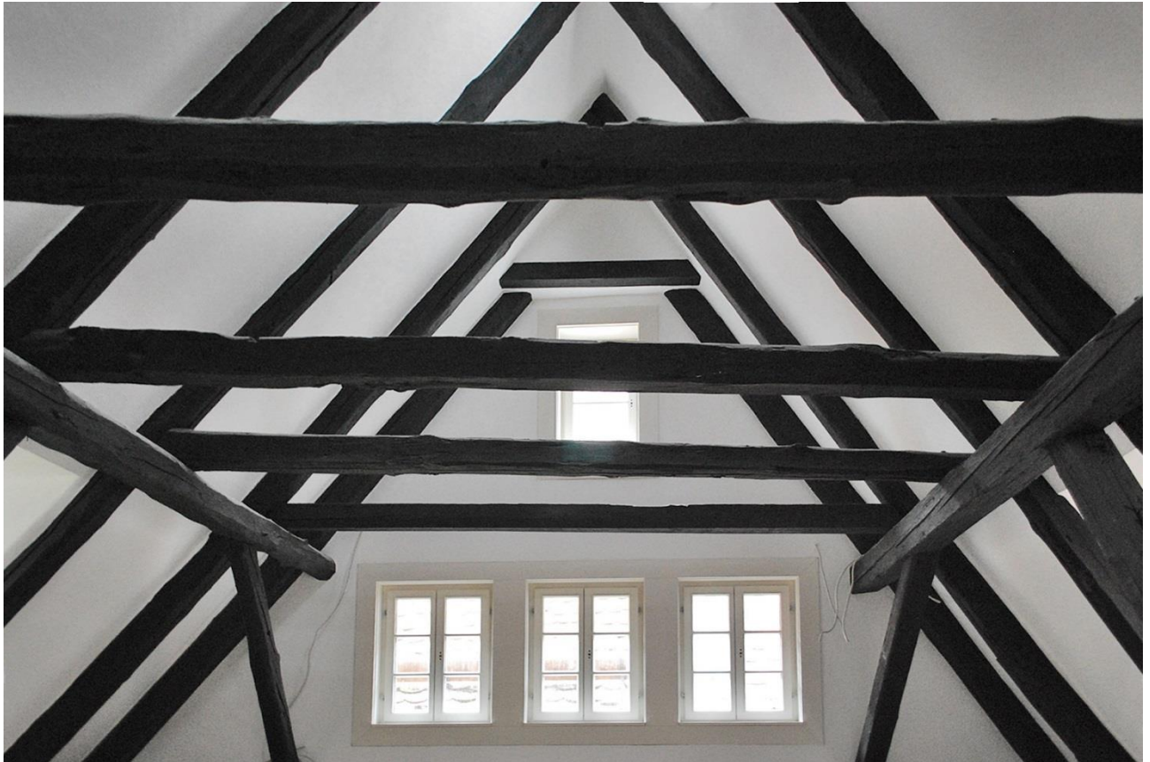
Rothenburg o.d.T.: Bürgerhaus 15.Jh