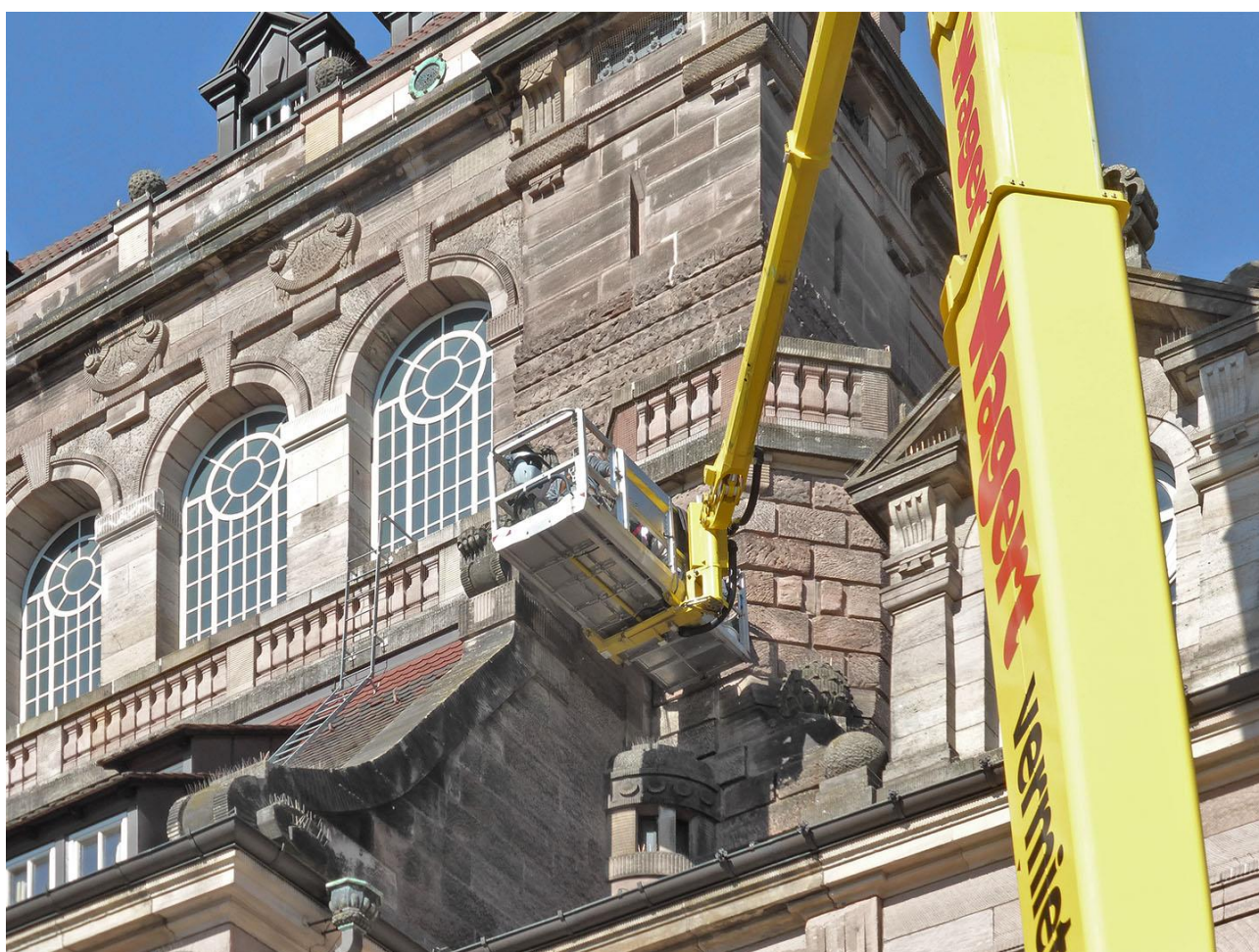
Nürnberg Opernhaus: Kartierung Naturwerksteinfassade und Dachhaut