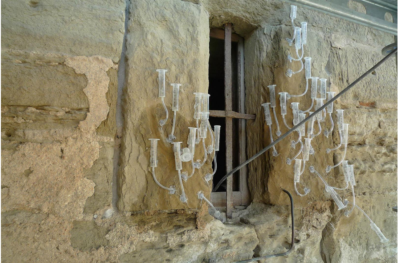
Ergersheim: St. Stefan