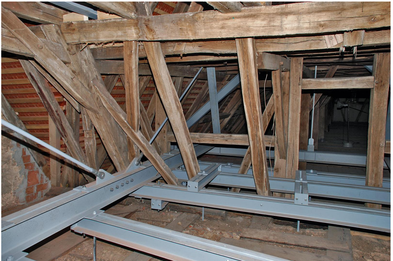
Schloss Unsleben | Instandsetzung Dachtragwerk