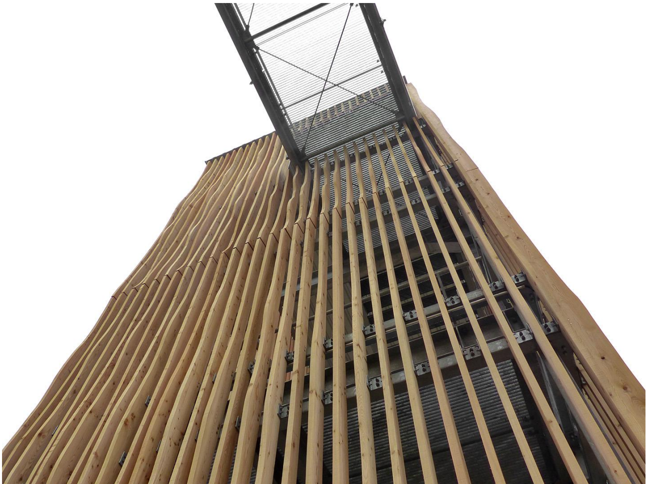
Bad Neustadt a. d. Saale: Fluchttreppenturm Mittelschule