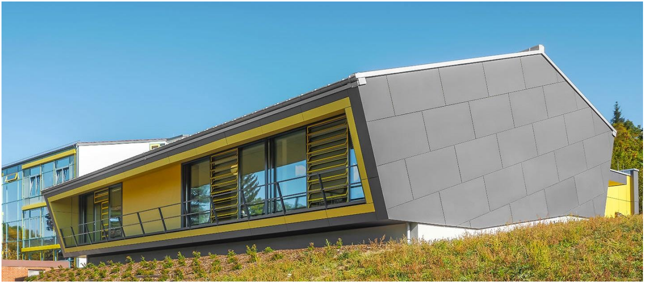
Feuchtwangen: Neubau Mensa