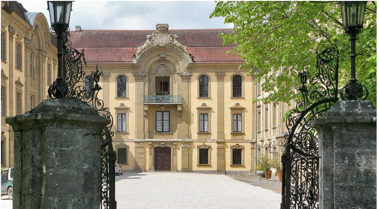
Schillingsfürst | Schloss