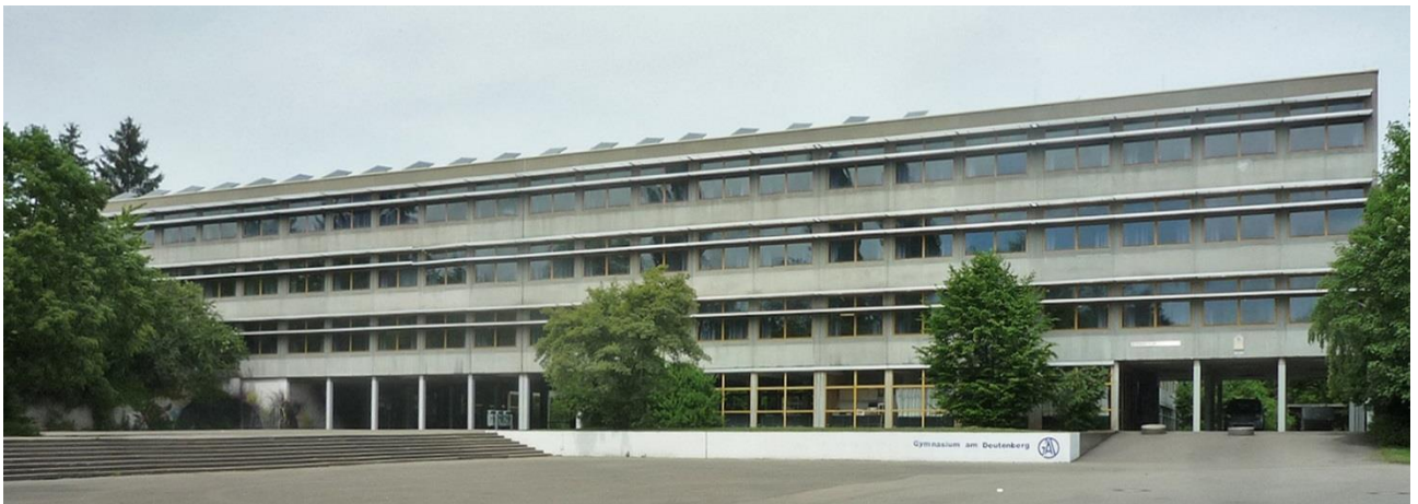
Villingen-Schwenningen: Gymnasium am Deutenberg – Brandschutzfachplanung