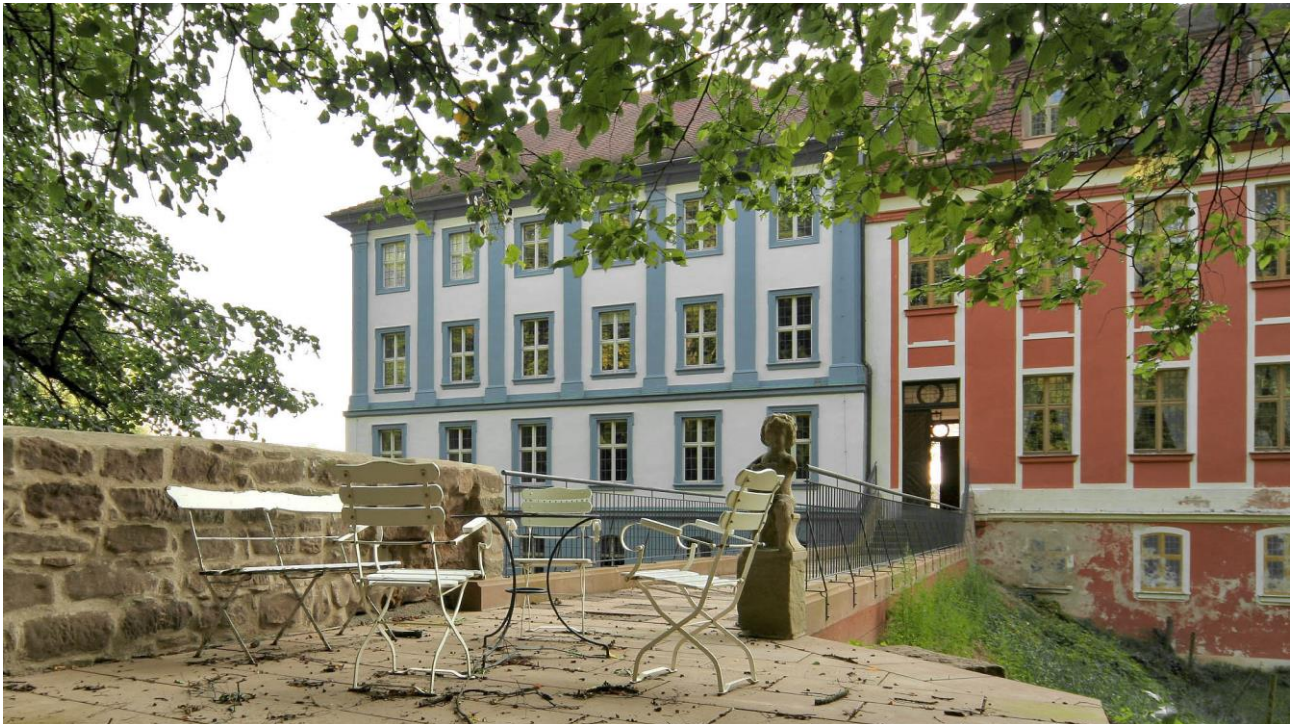
Oberzenn: Blaues und rotes Schloss (Laufendes Projekt)